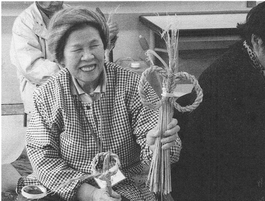
後川でのしめ縄作り